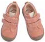
8031 / altrosa, mais, marine David Größe 20 bis 27