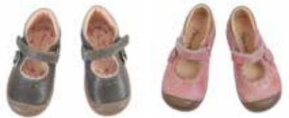
8001 / grau, altrosa Lucy Größe 20 bis 27