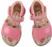
8021 / morning glory Lilo Größe 22 bis 27