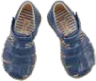
8026 / ocean, marine, erdbeer, mais Pauli Größe 20 bis 27