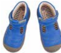
8015 / California blue-Ecopell, mais Simon Größe 20 bis 27