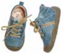
8022 / hellblau, altrosa Max Größe 20 bis 27