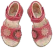
8029 / pink Greta Größe 22 bis 27