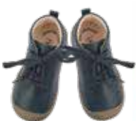
8003 / marine, erdbeer, cognac, puderrosa, mais, salbei James Größe 20 bis 27