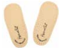
1232 Ersatz-Einlegesohlen Größe 20 bis 27